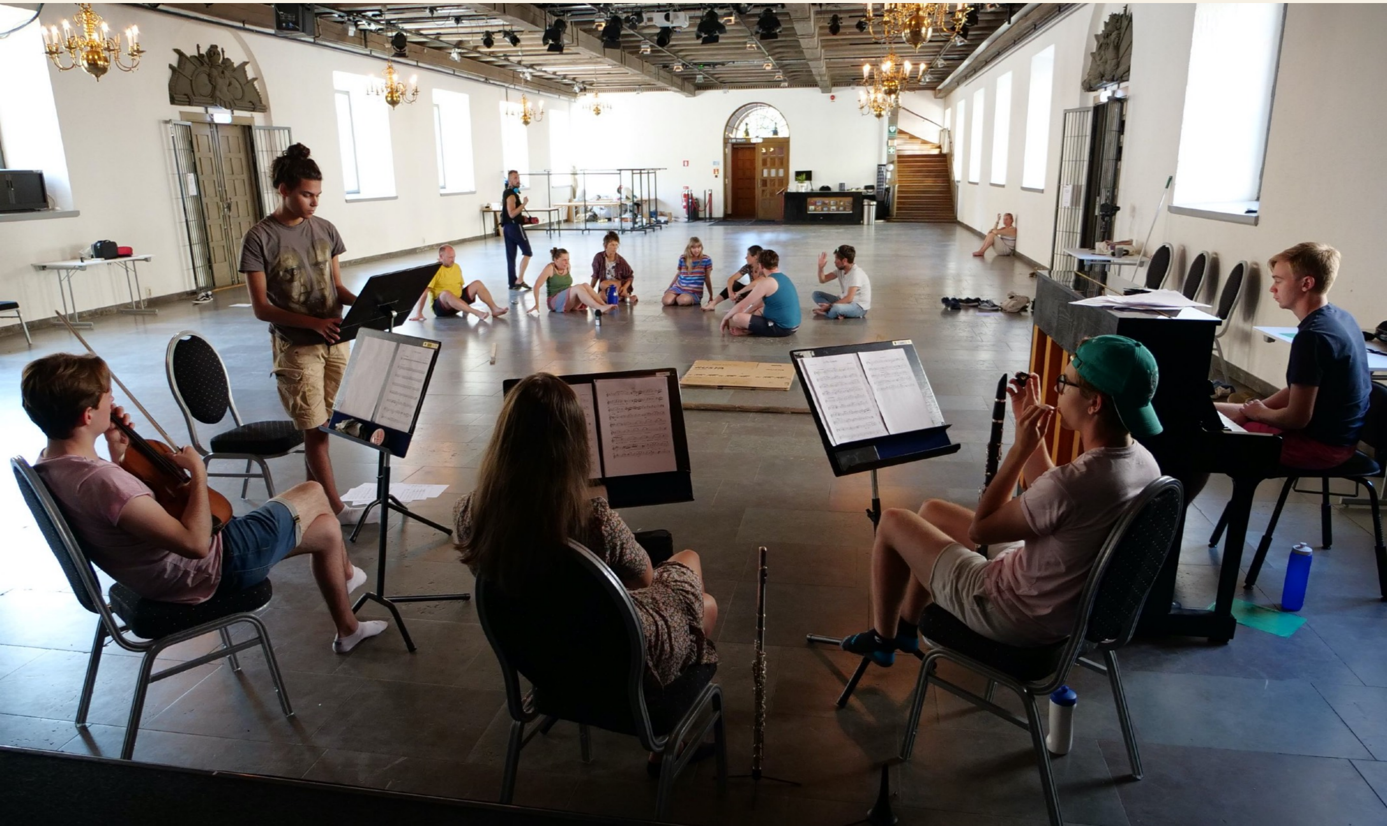
Augusti 2020, samverkansverkstad i Rikssalen, förberedande arbete för Göteborgs 400års jubileum.

“Kronhusområdet, ett nav för hållbar utveckling - socialt, ekologiskt och ekonomiskt.”