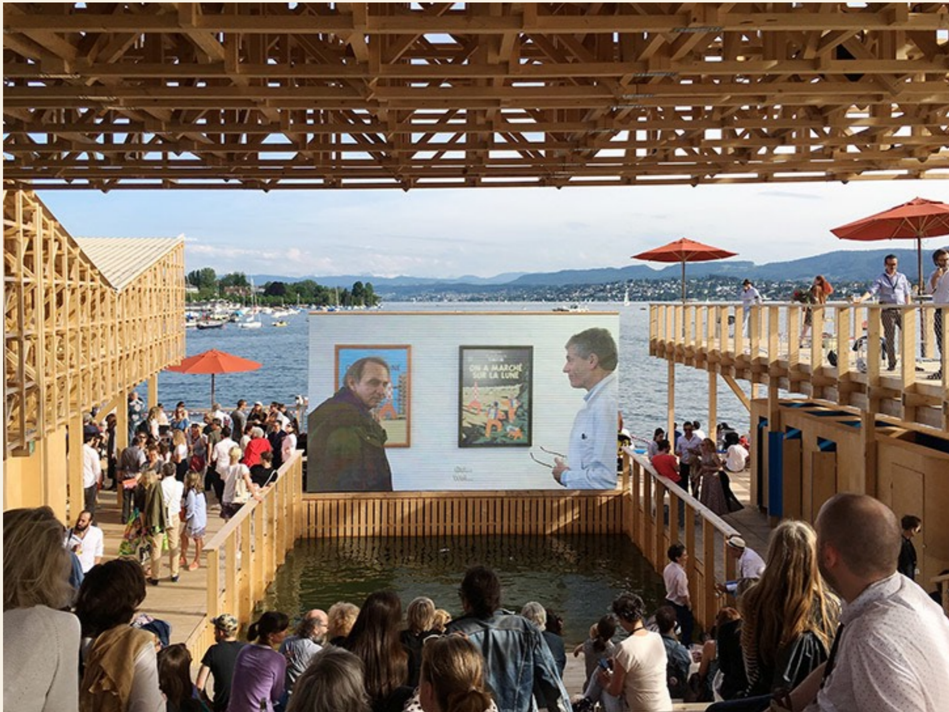
The Pavilion of Reflections Studenter från ETH Zurich i samarbete med Studio Tom Emerson